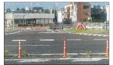
国道 125 号線入口